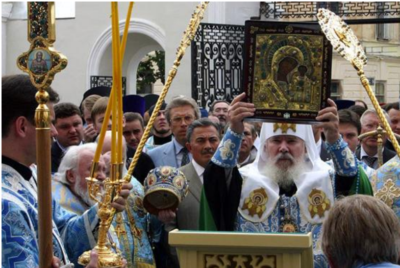
21 июня 2005 года, в год 450-летия основания Казанской епархии, Святейший Патриарх Московский и всея Руси Алексий II по окончании Божественной литургии в Благовещенском соборе Казанского Кремля передал верующим великую святыню - Казанскую икону XVIII в., находившуюся в покоях папы Римского Иоанна Павла II.

В 1721 году Петр перенес один из списков с Казанской иконы Богородицы из Москвы в Петербург, и в настоящее время святая икона Небесной Заступницы находится в Казанском соборе Санкт-Петербурга. В 1812 году Казанский образ Божией Матери осенял русских солдат, отразивших французское нашествие. В праздник Казанской иконы 22 октября 1812 года русские отряды под