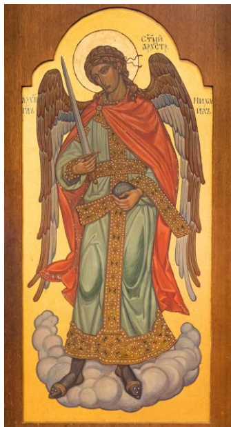
Икона Архангела Михаила на Южной (правой) двери в иконостасе в нашем Свято-Троицком храме

Празднование Собора Архистратига Божия Михаила и прочих Небесных Сил бесплотных установлено в начале IV века на Поместном Лаодикийском Соборе, бывшем за несколько лет до Первого Вселенского Собора. Лаодикийский Собор 35-м правилом осудил и отверг еретическое поклонение Ангелам как творцам и правителям мира и утвердил православное их почитание.