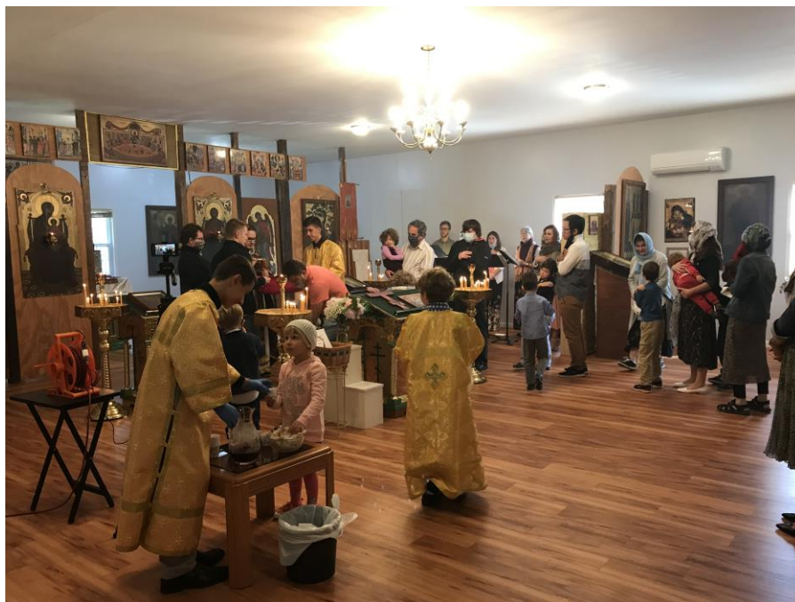
Наша Свято-Троицкая церковь, октябрь 2020 года.