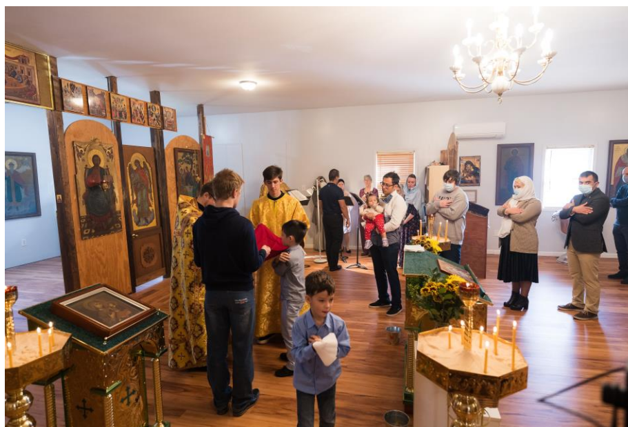
Свято-Троицкая церковь, ноябрь 2020 года.